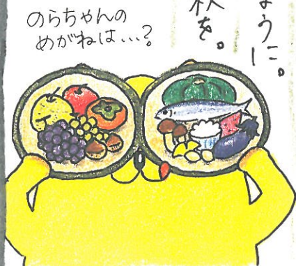
のらちゃんめがねは...?

株式会社 のらや ☎0120-680-908 https://www.noraya.com