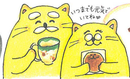
いつまでも元気ないてね