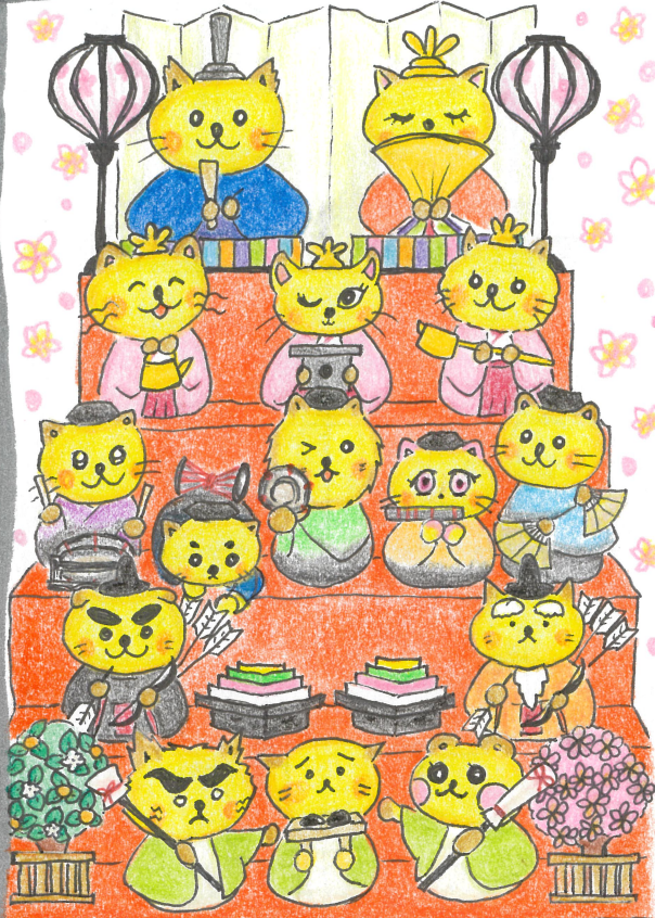
のらちゃん、どーニだ??

陽射しにぬくもりを感じ、鳥のさえずりが 春の到来を知らせているかのようです。 長引くコロナ疲れ…のらやが美味しさと ともに癒しや遊び心もお届けてきたらと 思っております。桃の節句に卒業式。 喜びと笑顔あふれる3月になりますように。