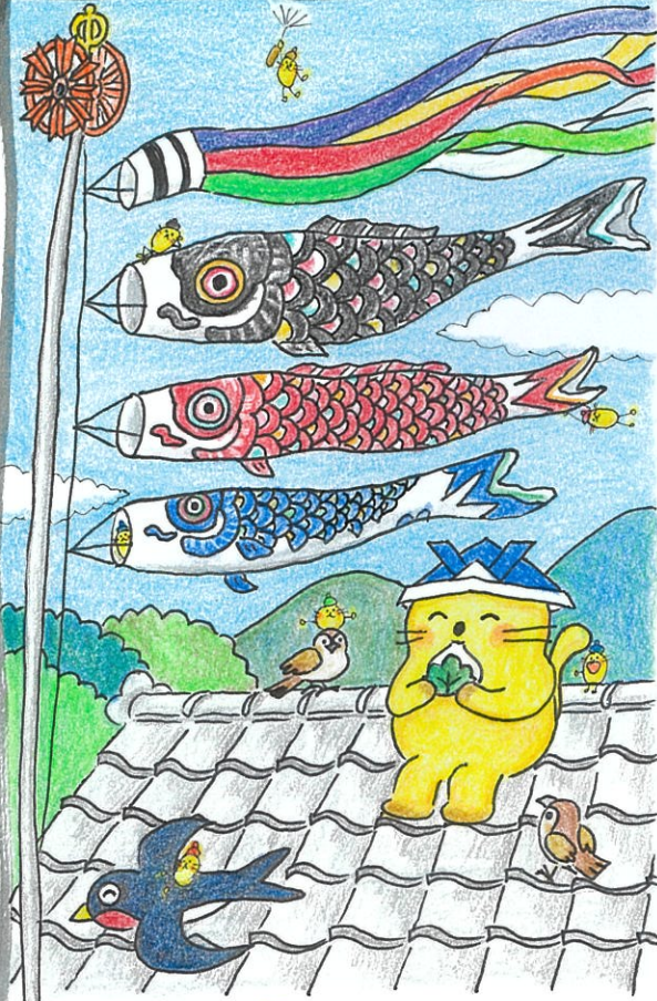
絵の中にミニのらが7匹かかれているよ。みつげね。

日中は汗ばむほどの陽気ですね。すっかり初夏の風景になりました。新生活や新クラスに少し慣れ、頑張る姿を見ると、応援したくなり「私も頑張ろう」と励みになります。こんなにさわやかな好季節での自粛生活に気疲れが溜まらぬようご自愛ください。