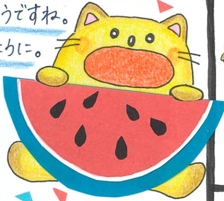
(紙面全体の中に☺のマークが6つかかれているよ。みつけてね。)