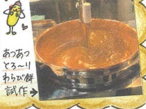
あつあつ とろろ わらび餅 試作