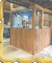
↑機械の搬入 設備工事

のらや初のクラウドファンディング 「あつあつ! できてるわらび餅プロジェクト」 おかげ様でたくさんのご支援を頂戴し、 目標金額 400万円を上回る 4615,000円を達成することが できました。6月中旬にオープン 予定です。ぜひのらや鳳本店 (大阪・場南)で、できてる わらび餅を味わってください!