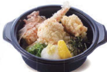
鶏ちく天ぶっかけうどん 1,180円(税込1,274円)