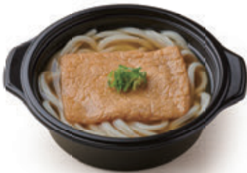
きつねうどん 830円(税込896円)